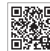
Facebook・Twitter・ YouTubeでも情報発信中!