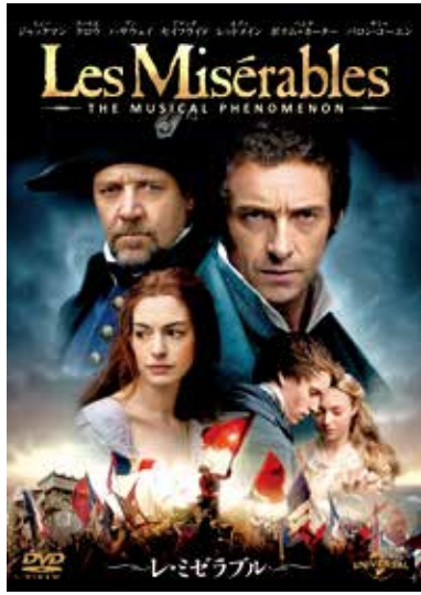
Film (C) 2012 Universal Studios.ALL RIGHTS RESERVED Artwork (C) 2013 Universal Studios.ALL RIGHTS RESERVED

【往信表面】宛先：〒781-8123 高知市高須 353-2 (高知県文化財団内) 高知県芸術祭執行委員会事務局「イベント応募」係